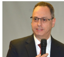
Álvaro Namen Vargas. Ex consejero de Estado